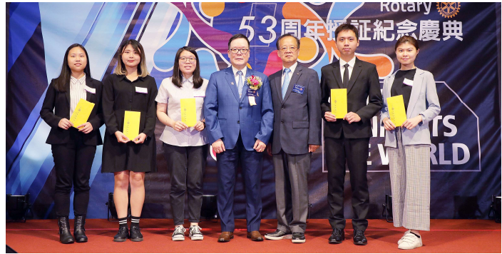
第二十四屆板橋扶輪社獎學生得獎學生