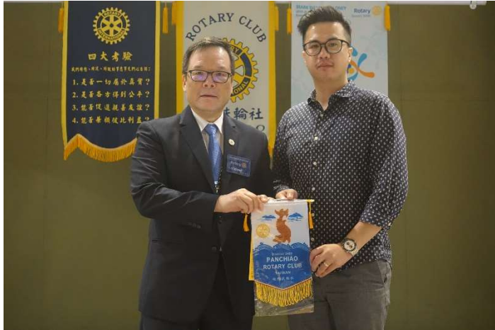
新北市衛生局照管中心三重分站