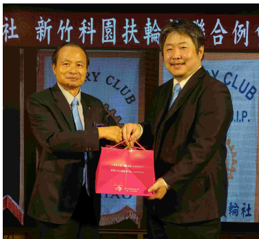
兄弟社主委 PP Book 贈送 中秋月餅予科園社