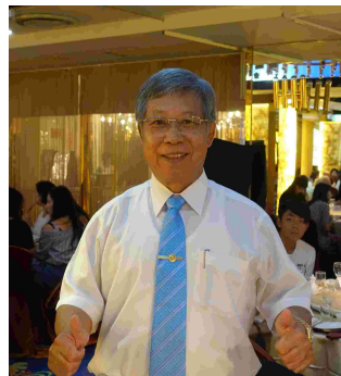
祝賀 Sticker 社友