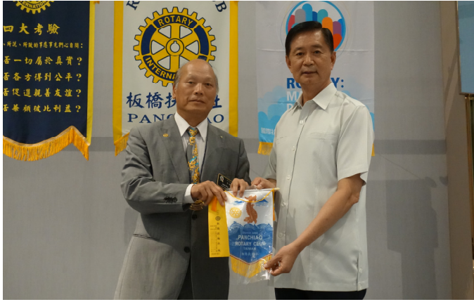
新北市政府警察局 艾鵬 副局長