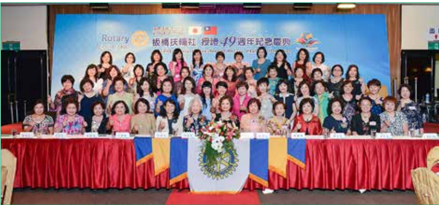
板橋扶輪社授證 49 週年紀念慶典圓滿成功 !!