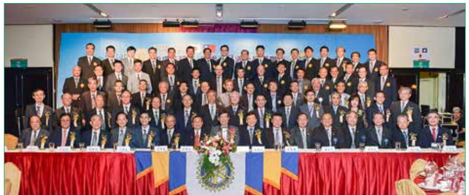
板橋扶輪社授證 49 週年紀念慶典圓滿成功 !!