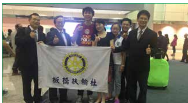
感謝 Bank 社長當選人、Family 社友、 Steven 社友前往接機