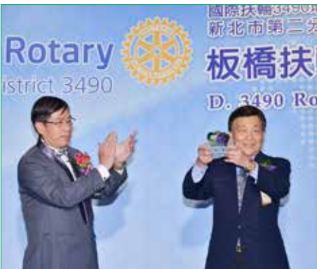
社長代表致贈禮品予 創社社友 PP Lion