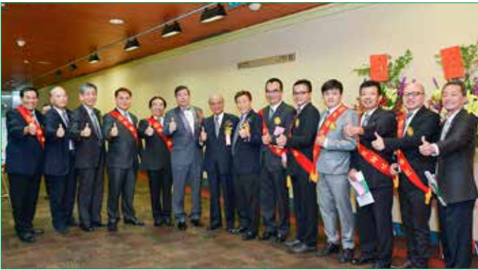
板橋扶輪社歡迎您 ~