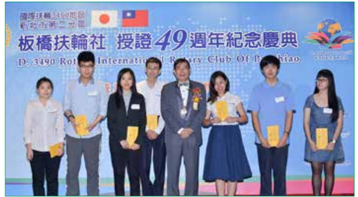
第二十屆板橋扶輪社獎學金得獎學生