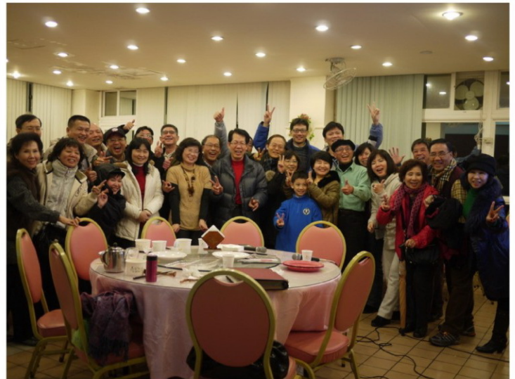
卡拉 OK 歡唱