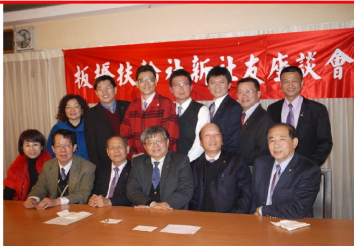
與會社友及夫人合影