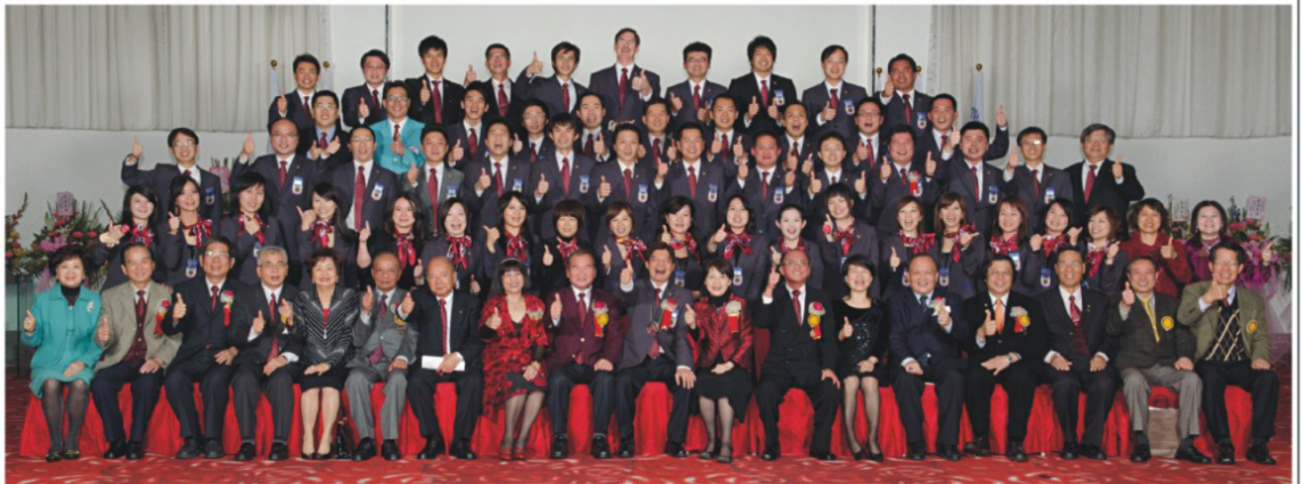
板橋群英扶輪社 CP.Ali 暨全體創社社友 DG.Victor 總監特別代表 PP.Archi 地區團隊 板橋扶輪社 Glue 社長暨輔導委員會合影