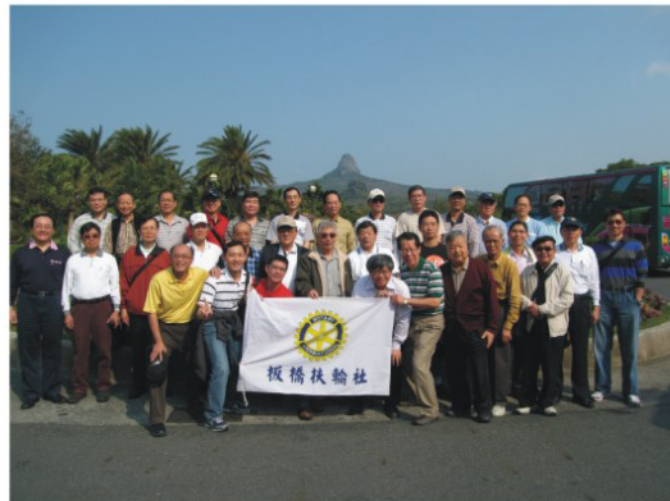
與會社友及寶眷合影