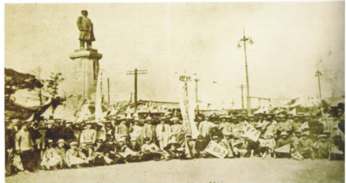
第五次臺灣議會設置請願在東京驛前，與東京臺灣青年會會員集結。搭乘九部汽車遊行東京市區，沿途散發傳單一其時蔣渭水尚在治警事件的假釋期間。