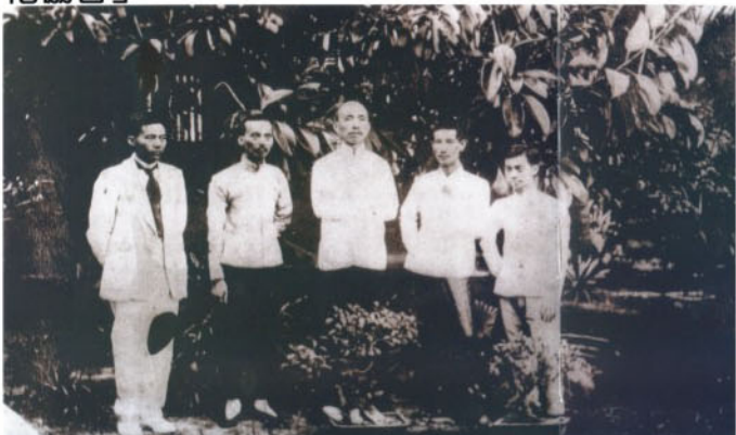
蔣渭水（左一）與林幼春、林獻堂、莊太岳、林資彬