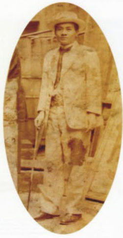
文化講演後被丟泥巴 蔣渭水講演後， 突遭警察唆使流氓丟擲泥巴， 遂將泥巴印記視為勳章， 特別「寫真」存證