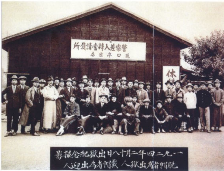
1924年2月18日出獄紀念攝影 脫帽者為出獄人 戴帽者為出迎人