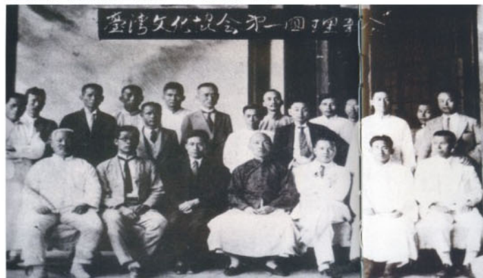
前排左起洪元煌、黃呈聰、蔣渭水、林獻堂、連溫卿 後排左起為蔡培火、陳虛谷 蔣渭水後面左起丁瑞圖、林資彬、林幼春、王敏川、 鄭汝南 後排右起謝春木、賴和、陳逢源